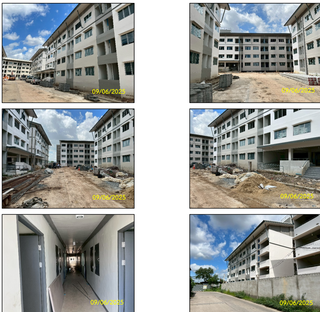
ภาพที่ 1-2 สภาพปัจจุบันของโครงการ

โครงการอาคารเช่าสำหรับผู้มีรายได้น้อย จังหวัดฉะเชิงเทรา (บางปะกง) จากการสำรวจพบว่าทางโครงการได้มีการตอกเสาเข็มโดยใช้เข็มตอกไปแล้วจำนวน 10 อาคาร ตั้งแต่เดือนมีนาคม – กันยายน 2562 สำหรับอีก 2 อาคารที่เหลือซึ่งอยู่ใกล้กับพื้นที่ชุมชนทางโครงการเลือกใช้เข็มกดเพื่อลดผลกระทบด้านเสียงและความสั่นสะเทือนไม่ให้เกิดผลกระทบต่อชุมชนใกล้เคียง ซึ่งดำเนินการตั้งแต่วันที่ 10 -27 ธันวาคม 2562 เรียบร้อยแล้ว ซึ่งในปัจจุบันงานก่อสร้างฐานรากแล้วเสร็จ ปัจจุบันการเคหะแห่งชาติ ได้มอบหมายให้ บริษัท กิจการร่วม RN and HN Consortium เป็นผู้ดำเนินการก่อสร้างโดยมีระยะเวลาก่อสร้างตามสัญญาเริ่มตั้งแต่วันที่ 8 สิงหาคม พ.ศ. 2566 มีกำหนดแล้วเสร็จวันที่ 1 สิงหาคม พ.ศ. 2567 รวมระยะก่อสร้าง 360 วัน ภายใต้การควบคุมงานก่อสร้างโดยการเคหะแห่งชาติ ได้แก่งานก่อสร้างและงานก่อสร้างอาคาร คิดเป็นความก้าวหน้าของงานก่อสร้างร้อยละ 85 (เดือนมิถุนายน พ.ศ. 2568) ของงานก่อสร้างทั้งหมด (ดังภาพที่ 1-2)